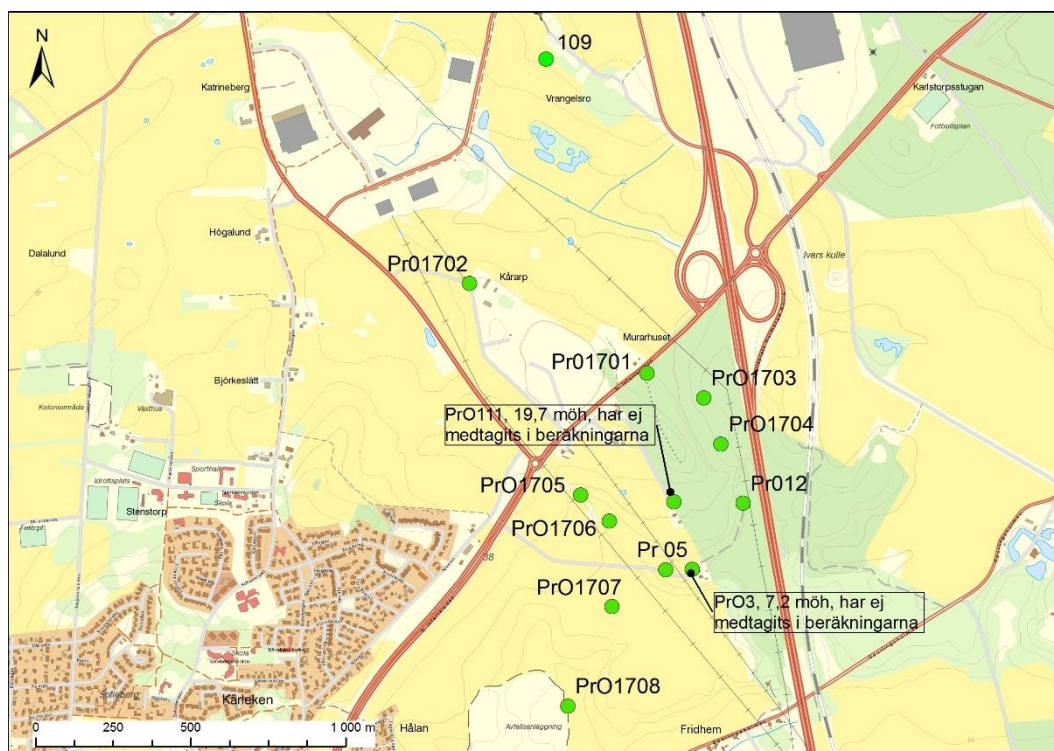
Figur 2 Observationsrör och grundvattennivåer uppmätta i november 2017 som använts vid transporttidsberäkningarna för Prästjorden. Grundvatteninfiltrationen hade då pågått i ca 4 månader. Rör 109 är ett gammalt rör som ej är i bruk längre.