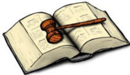
Teckning: Mathias de Maré

Tvister som rör vatten- och avloppsförsörjning behandlas av en särskild domstol som heter Statens VA-nämnd. Hur denna fungerar och hur ett ärende anmäls till Statens VA-nämnd framgår av deras hemsida.