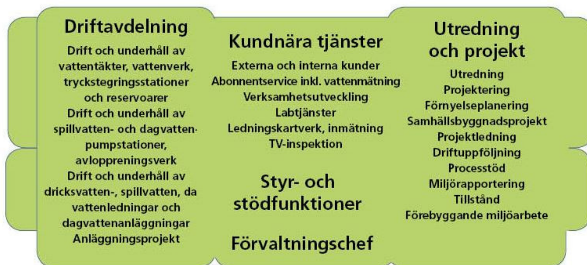
Figur 1. Organisationsschema för Laholmsbuktens VA.

Nämnden för Laholmsbuktens VA ansvarar för drift av vatten-, spillvatten- och dagvattenverksamheten i Halmstads och Laholms kommuner. Den gemensamma nämnden ingår i Halmstads kommuns organisation. Sedan 2014-07-01 är Laholmsbuktens VA en egen förvaltning som är indelad i tre avdelningar, se figur 1.